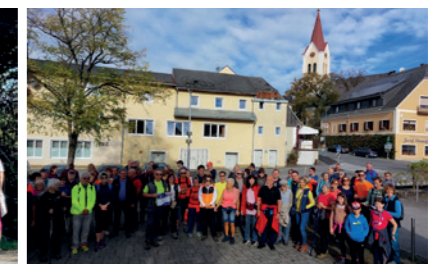
2023 St. Nikolai i. S.