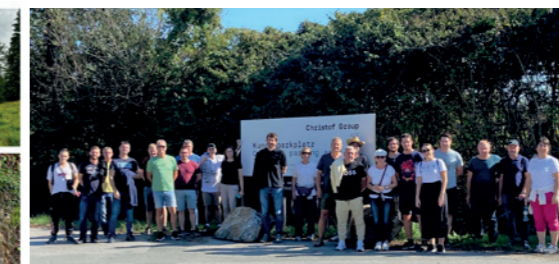
2023 Christof Group